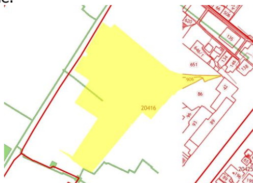
Рисунок – Конфигурация земельного участка

1. Земельный участок с кадастровым номером 26:21:020416:906, расположенный по адресу: Ставропольский край, город Буденновск, ул. Строительная, площадью 121 484 кв. м., категория Земли населённых пунктов, вид разрешенного использования - под промышленное предприятие.